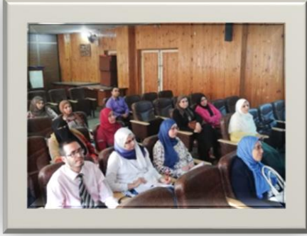
دورة معاهير الورقة الامتحانية