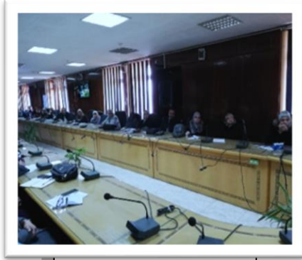
ورشة عمل بنوك الاستدلاء