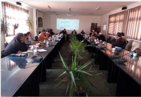
دورة الاختبار الموضوعي بكلية الزراعة